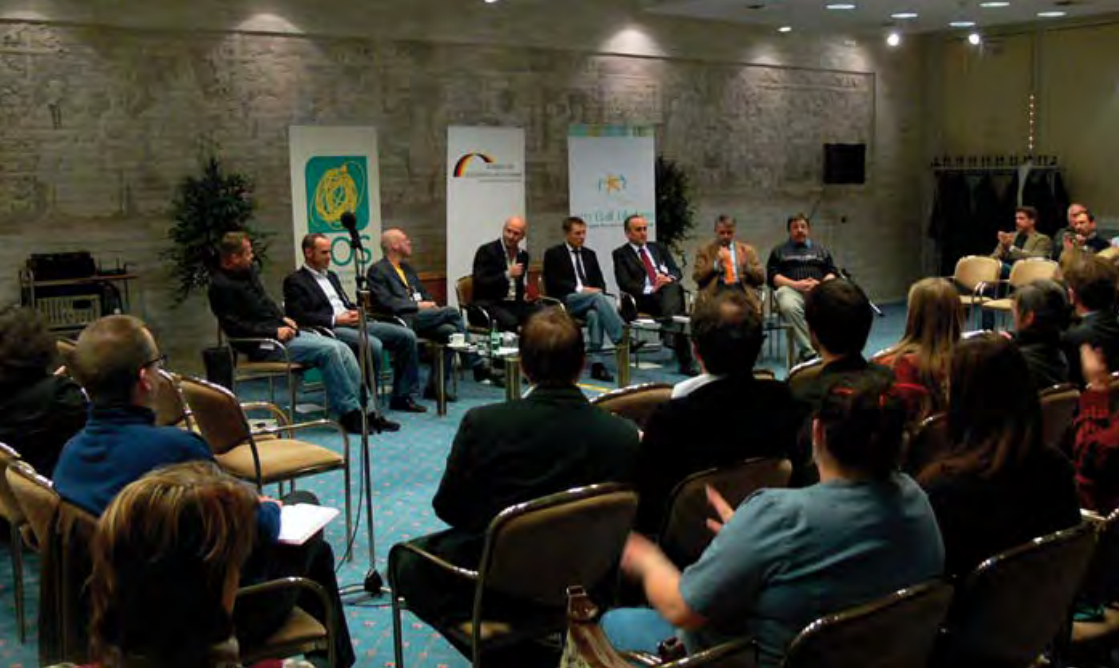
1. bundesweiter Kongress »Vereine Stark machen« in Halle/Saale